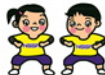
NSSA 日本スポーツ科学 協会