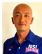
西内 洋行 2000年アテネ五輪 2004年アテネ五輪 トライアスロン日本代表