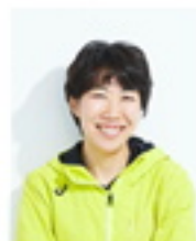
中村 友梨香 2008年 北京オリンピック マラソン日本代表