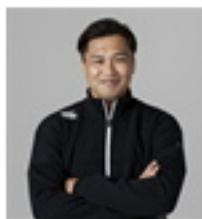
大西 将太郎 2007年 ラグビーワールドカップ フランス大会日本代表